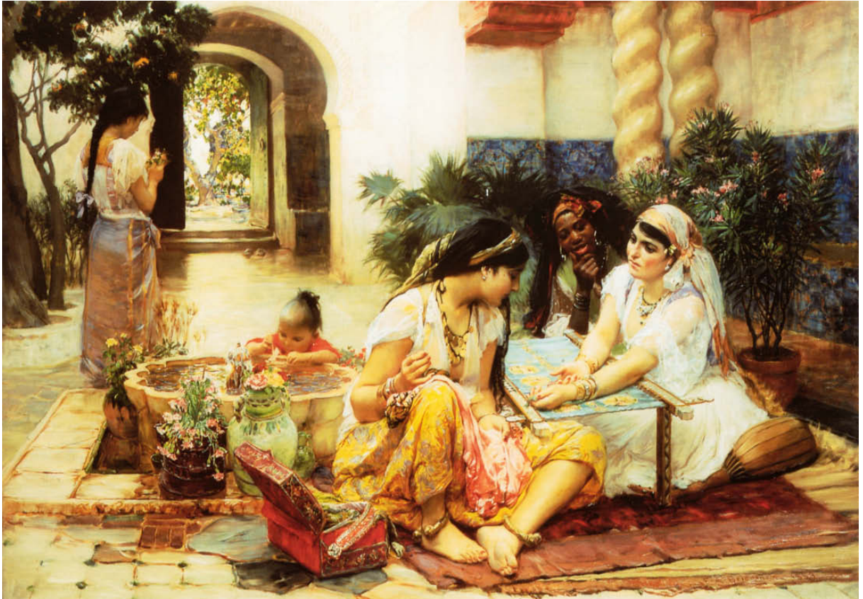
FIGURA 6 - Frederick Arthur Bridgman, In a Village, El Biar, Algeria , 1889. (Collezione pubblica)