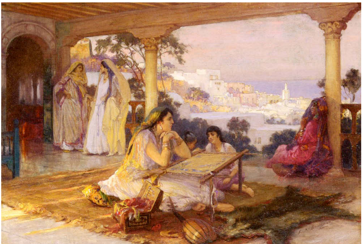
FIGURA 5 - Frederick Arthur Bridgman, An Eastern Veranda , s.d. (Collezione privata)