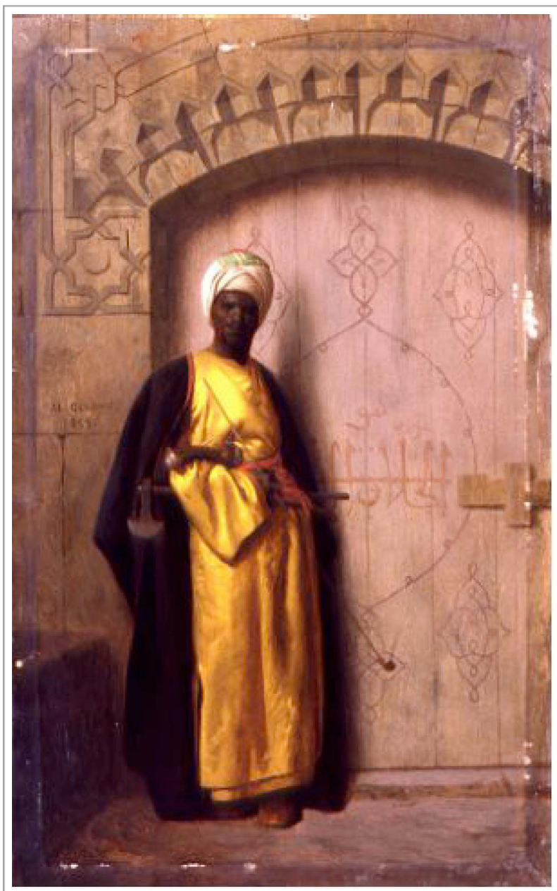
Figura 9 - Jean-Léon Gérôme, Il guardiano dell'harem , 1859.

Dopo aver superficialmente sfiorato la questione degli spazi e delle dinamiche di negoziazione della libertà tra i due sessi nel contesto dell'autorità materna, ci troviamo ora di fronte alla prima fase del meccanismo di azione e reazione nella conquista dello spazio, vale a dire l'imposizione della segregazione da parte del Padre.