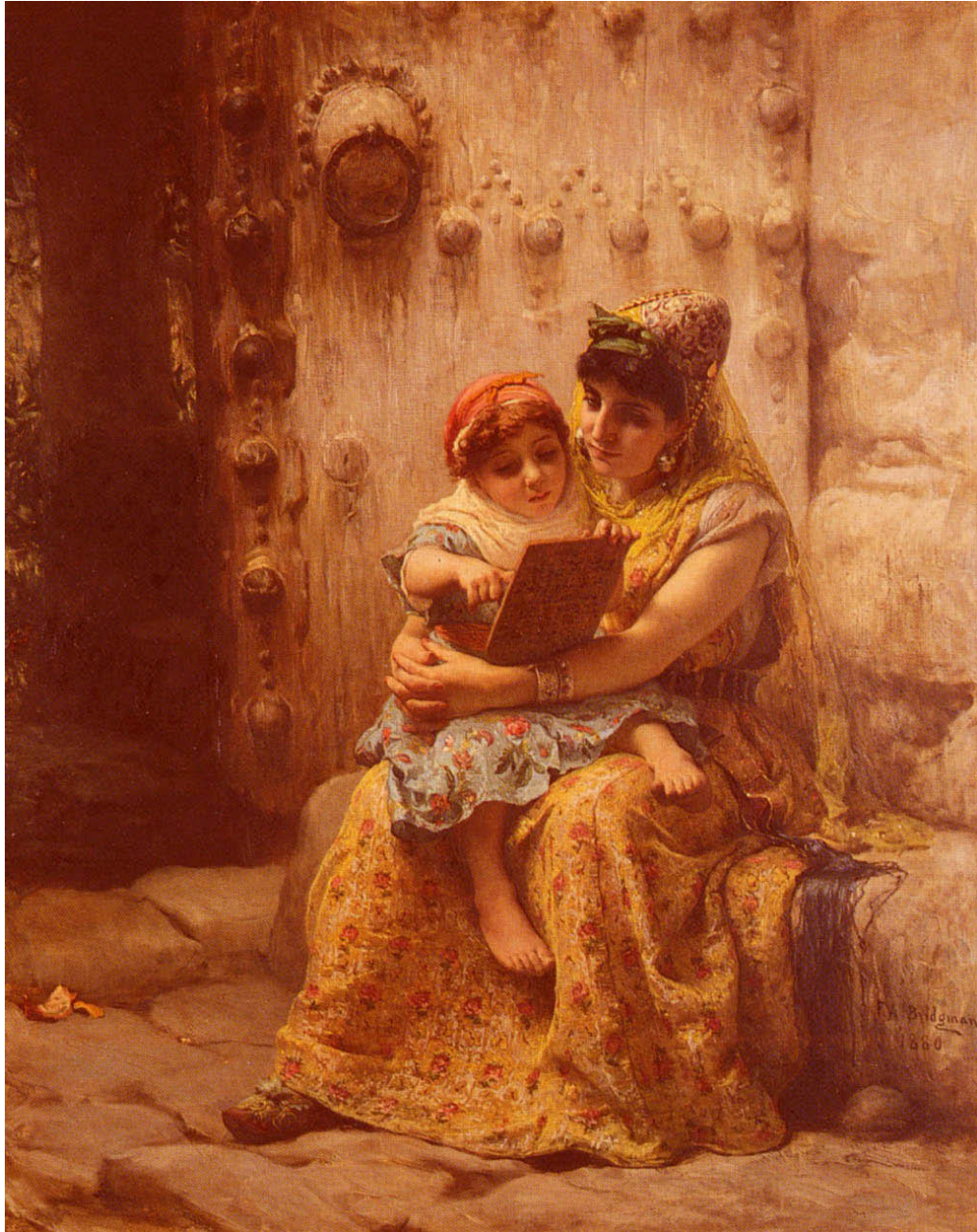
FIGURA 1 - Frederick Arthur Bridgman, The Reading Lesson , 1880. (Collezione privata)