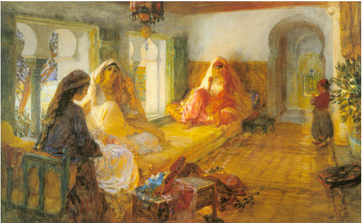
FIGURA 7 - Frederick Arthur Bridgman, In The Seraglio , 1901. (Collezione pubblica)