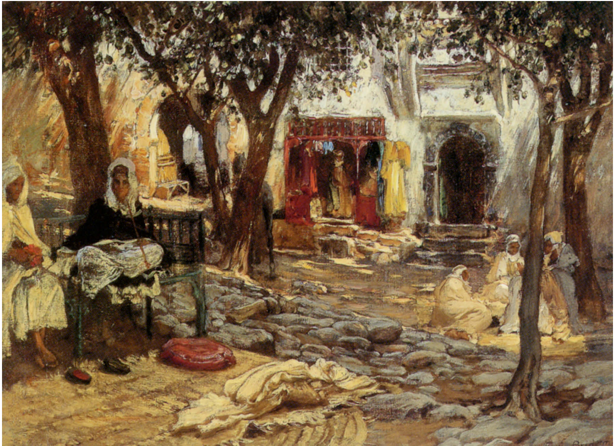
FIGURA 4 - Frederick Arthur Bridgman, Idle Moments An Arab Courtyard , s.d. (Collezione privata)