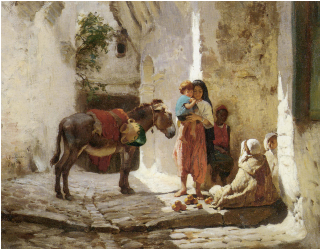
FIGURA 3 - Frederick Arthur Bridgman, The Orange Seller , 1873. (Collezione privata)