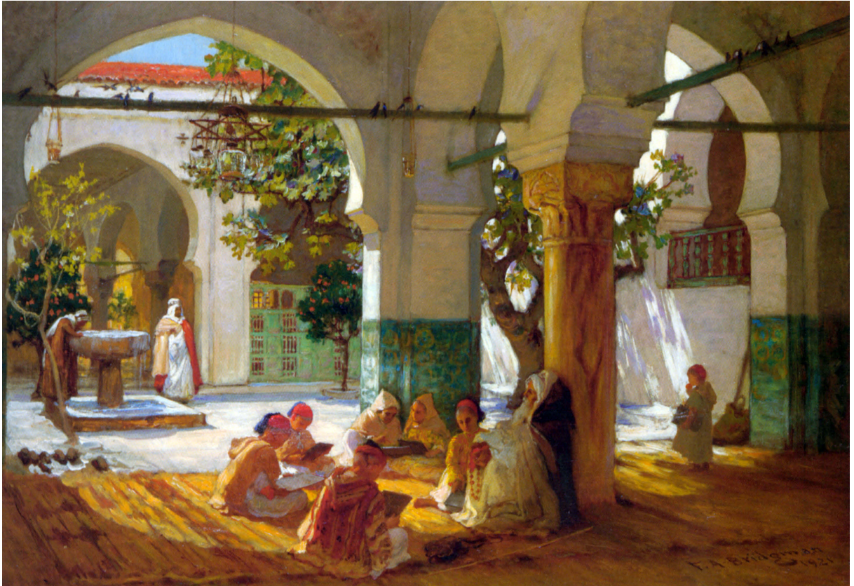
FIGURA 8 - Frederick Arthur Bridgman, Learning The Qu'ran , 1921. (Collezione privata)