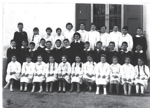
Scuola Sacro Cuore - Anno 1957/58