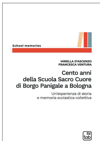
Fig. 2 Copertina del volume sui Cento anni della Scuola Sacro Cuore