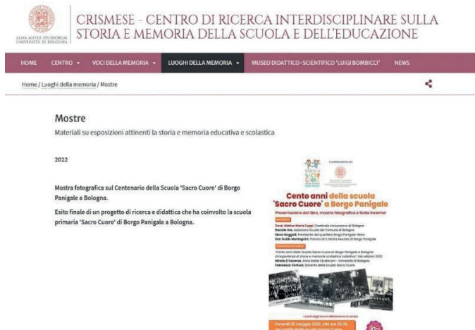
Fig. 7. Presentazione dell'attività sul sito del CENTRO di Ricerca Interdisciplinare sulla Storia e MEMoria della Scuola e dell'Educazione – CRIMESE